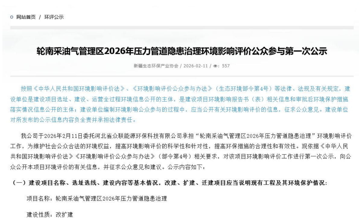
图 2-1 第一次信息公示情况

2026 年 2 月 11 日，我公司于新疆维吾尔自治区生态环境保护产业协会网站 ( http://www.xjhbcy.cn/articles/show/17034 ) 上发布了第一次公示信息。首次公示网络截图见图 2-1。