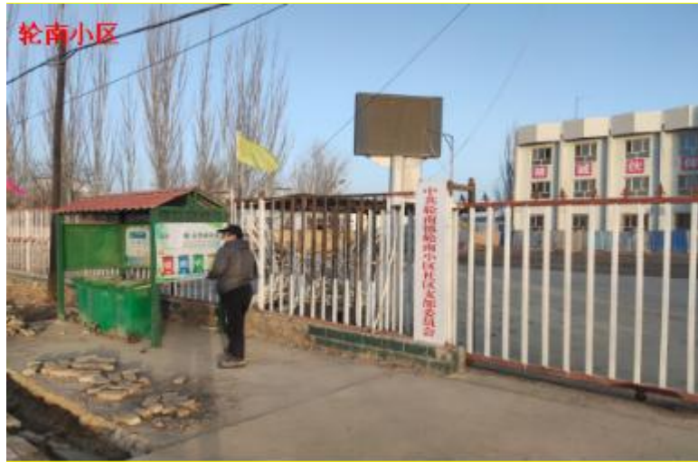
图 3-4 2026 年 3 月 14 日周边村庄张贴公示情况